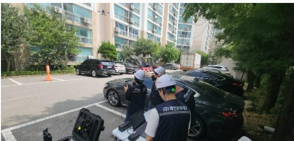
사공현장 실시간 검사